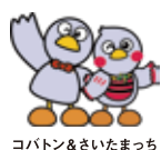
コバトン&さいたまっち

〒363-0022 埼玉県桶川市若宮1-5-9 さいたま文学館 TEL048-789-1515 ※受付時間 9:00~17:00(月曜日、第4火曜日の休館日を除く)